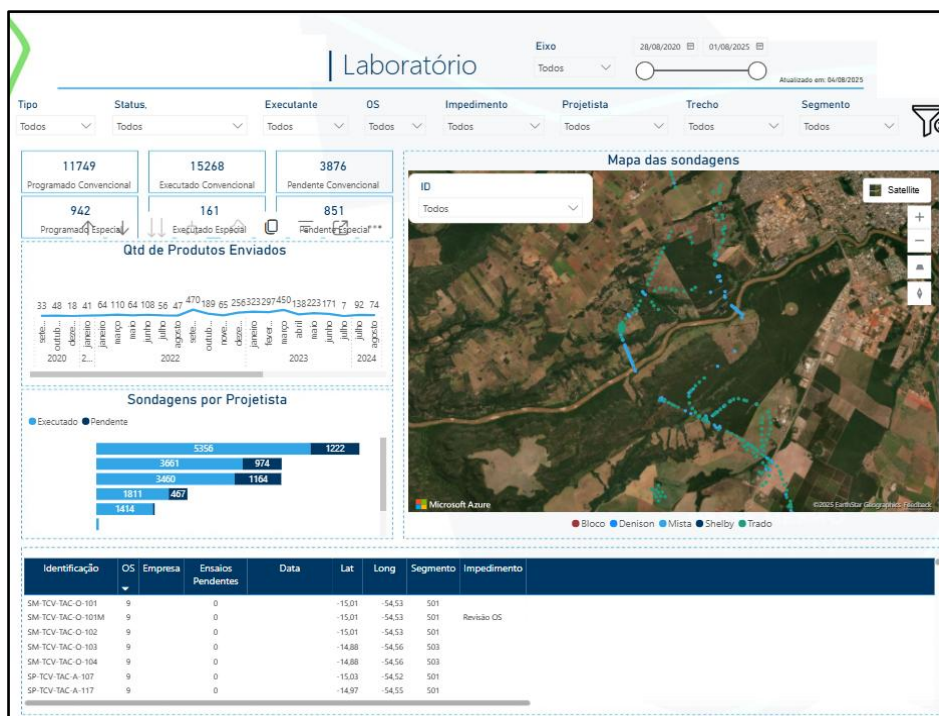
Figura 2. Dashboard do Power BI com indicadores e mapa georreferenciado das atividades laboratoriais.

A Figura 2, por sua vez, exibe o dashboard voltado às atividades laboratoriais. Também apresenta indicadores quantitativos, mapa georreferenciado e filtros interativos, permitindo o acompanhamento detalhado das análises em curso.